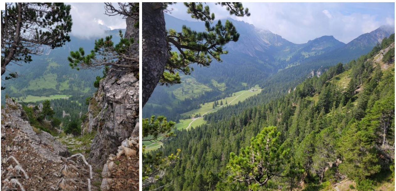
Blick vom Galinagrätli