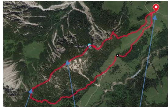
Galinasätele Galinagrätle Alpe Gamp

Rast auf der Lohnspitze und am Galinasätele