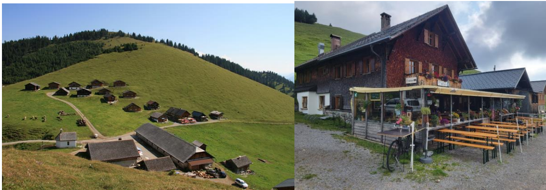
Blick auf den Gampberg und Berghaus Mattajoch

www.gamp.at . +43 680 3125108 kontakt@gamp.at Sabrina Seyfried