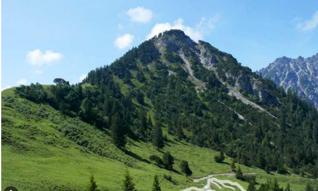
Blick auf die Lohnspitze

Wanderung von der Alpe Gamp über die Lohnspitze weiter über das Galinagrätli bis zum Galinasätele und über die Alpe Vordergamp zurück.