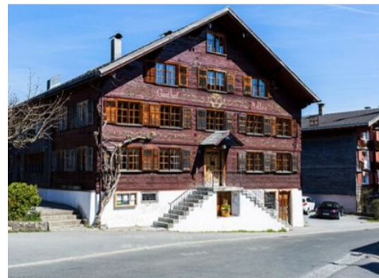
Gasthaus Adler Schwarzenberg www.adler-schwarzenberg.at