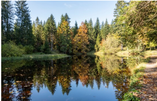
Bödele See / Fohrmoos Wanderung