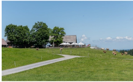
Meierei Bödele www.meierei-boedele.at/