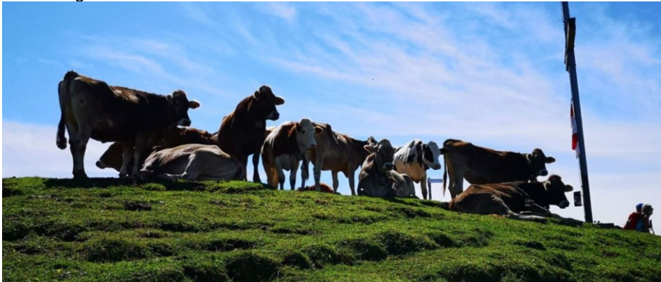
Hohe Kugel im Sommer mit Alp Kühen