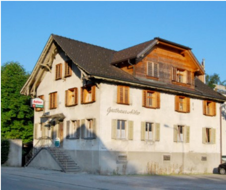
Gasthaus Adler Hohenems