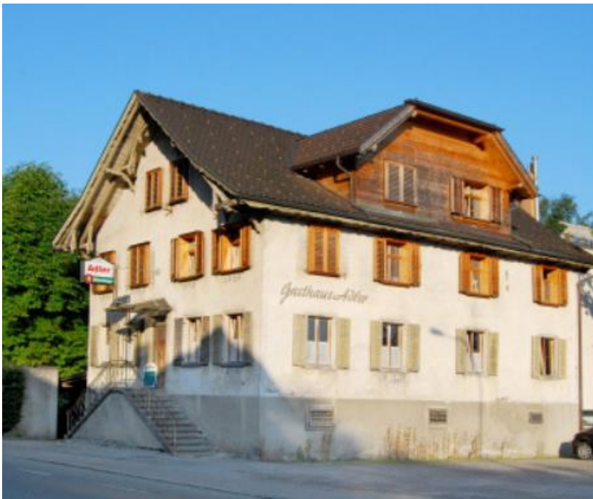
Gasthaus Adler Hohenems

Anmeldung bitte bis spätestens Freitag 9. Oktober 2020 per Mail oder Telefon an josef.bitsche@aon.at Tel. +43 664 1228316